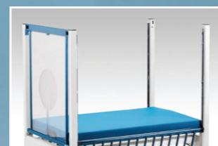
Kopf- und Fußteil mit herausnehmbaren und austauschbaren Einsätzen (Gitterstabrahmen oder Plexiglas)