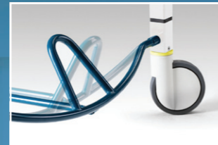
Fußbügel für zentrale Verriegelung der Rollen/Führungsrollenfunktion