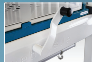
Mechanische Hoch-/Tiefverstellung. Option: Elektrisch