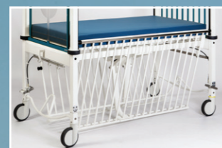
Seitenteile können unter die Liegefläche mit Gasfederunterstützung Hoch-/Tiefverstellung weggedreht werden