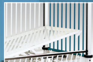
T/AT-Verstellung mit Gasfederunterstützung