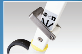
Fußbedienung Seitenteile Rollen Ø 150 mm